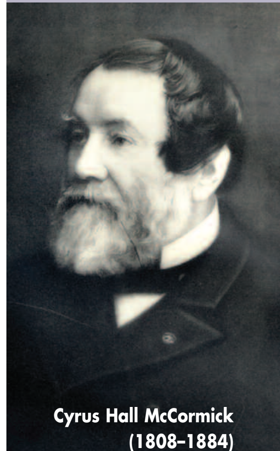
Cyrus Hall McCormick (1808-1884)